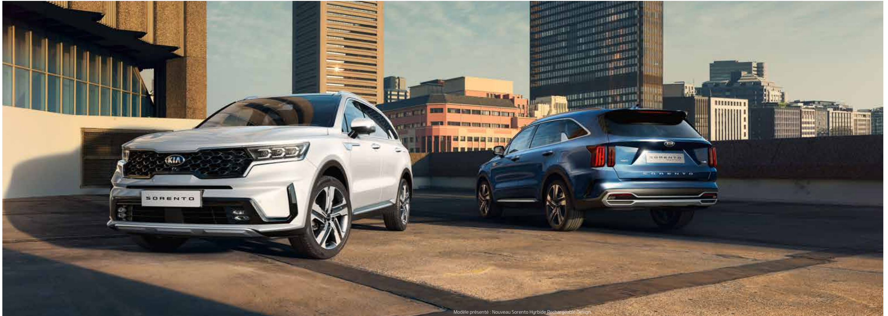
Modèle présenté : Nouveau Sorento Hybride Rechargeable Design

Si vous voulez vivre, comme bon vous semble, sans compromis, alors le nouveau Kia Sorento avec sa motorisation électrifiée est clairement fait pour vous. Vous souhaitez une conduite sans émission ? Le nouveau Kia Sorento Hybride Rechargeable saura répondre à vos attentes grâce à son mode 100 % électrique. Vous serez séduit par son design élancé et tout en puissance, conjugué à un habitacle aussi spacieux que confortable et luxueux. L'assurance de sillonner les rues des villes avec élégance sans vous soucier des regards réprobateurs. Vos règles – votre choix.