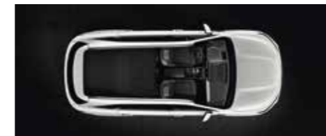
Sièges de la 2 ème rangée totalement repliés à plat (5 places)

Quels que soient vos projets et quoi que vous souhaitiez emporter, le Sorento est paré.