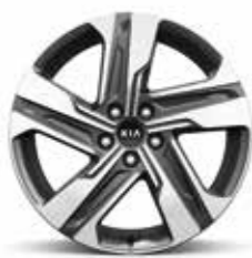
Jantes en alliage 19" (de série sur toute la gamme)