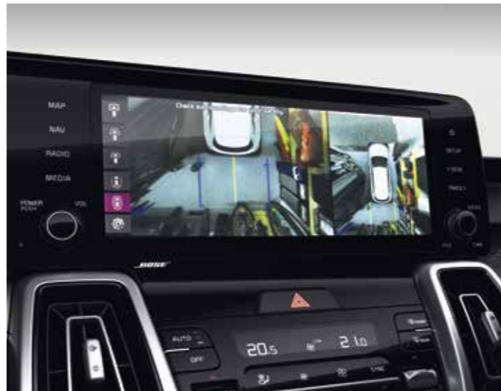
MONITEUR PANORAMIQUE 360°

Voyagez en toute sécurité : pour que vous ne quittiez pas la route des yeux, l'affichage tête-haute (de série sur la finition Premium) projette des graphiques et autres informations de conduite sur le pare-brise, directement dans votre champ de vision.