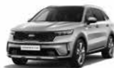
Gris Aluminium (4SS) (1)