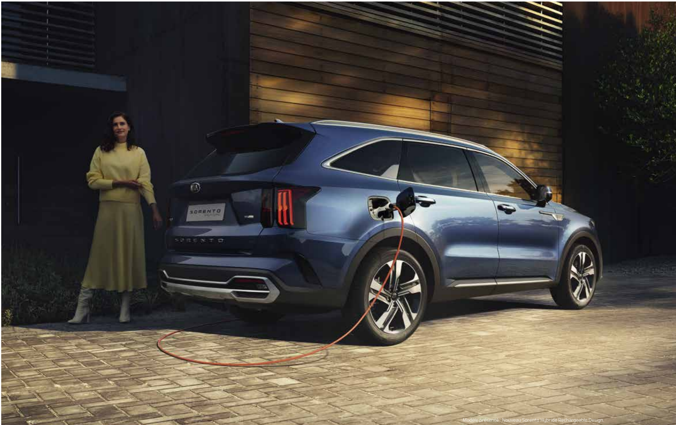
Modèle présenté : Nouveau Sorento Hybride Rechargeable Design.