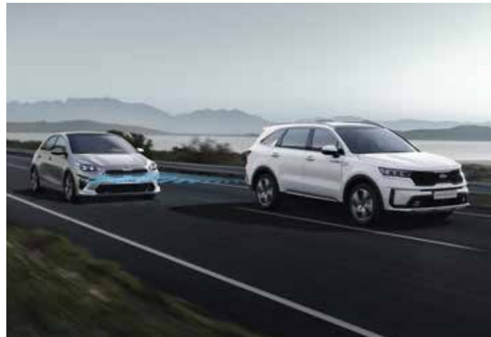
SYSTÈME ANTI-COLLISION AVEC DÉTECTION DES ANGLES MORTS (BCA)

Personne ne sait ce que nous réserve la route, c'est pourquoi le nouveau Sorento est équipé de solutions de pointe pour garantir une sécurité accrue.