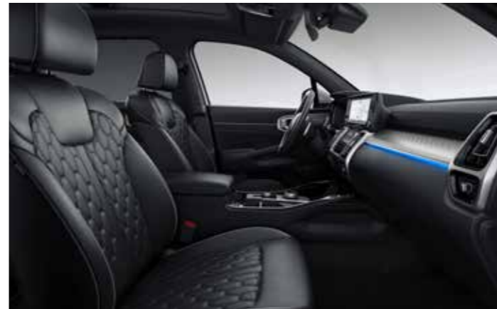
SIÈGES À RÉGLAGE ÉLECTRIQUE AVEC FONCTION MÉMOIRE

Surveillance panoramique : ce système intuitif (de série sur la finition Premium) combine quatre images grand angle issues des caméras situées à l'avant, à l'arrière et sur les côtés du Sorento pour fournir au conducteur une vue à 360° de l'espace environnant lors des manœuvres de stationnement ou en conduite à une vitesse inférieure à 20 km/h.