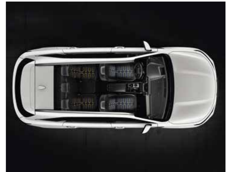
SIÈGES CHAUFFANTS ET VENTILÉS

Pour créer une parfaite atmosphère, le Sorento bénéficie d'un éclairage d'ambiance paramétrable (de série dès la finition Design) intégré dans les portes et sous la planche de tableau de bord, offrant un choix de sept couleurs principales et jusqu'à 64 autres couleurs afin de s'adapter à vos envies et de rendre chaque trajet aussi paisible ou palpitant que vous le souhaitez.