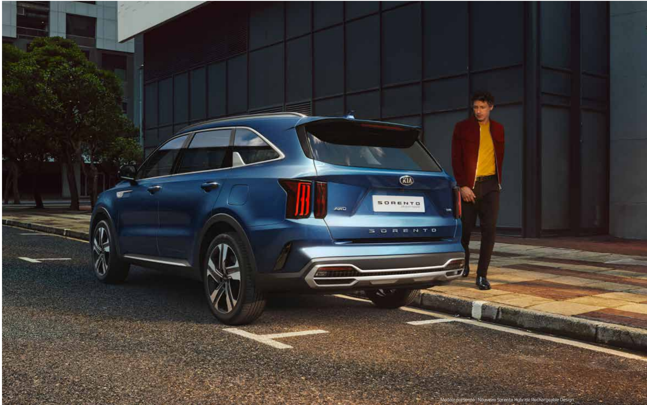
Modèle présenté : Nouveau Sorento Hybride Rechargeable Design.