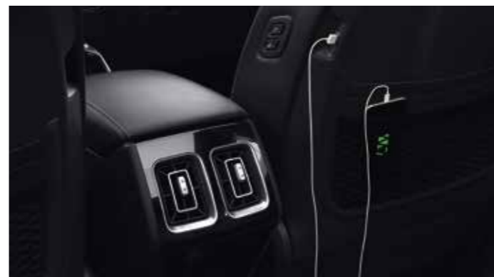
PORTS USB ET PRISE ÉLECTRIQUE POUR TOUS

Profitez du nec plus ultra du divertissement embarqué avec 12 haut-parleurs, un amplificateur externe et des technologies de pointe (de série sur la finition Premium). Transformez toute source audio stéréo ou multicanal en une incroyable expérience surround.