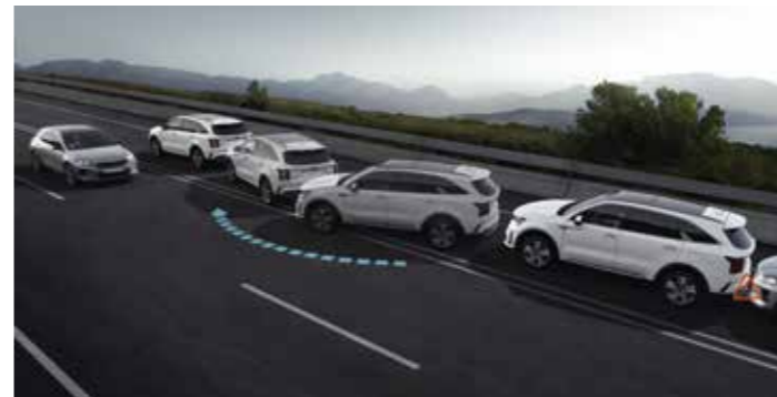
SYSTÈME DE FREINAGE MULTICOLLISION (MCB)

Ce système vise à empêcher les passagers arrière de sortir du véhicule s'il détecte un danger éventuel à l'approche. Dans ce cas, le système déclenchera le verrouillage des portes et émettra un signal sonore et visuel.