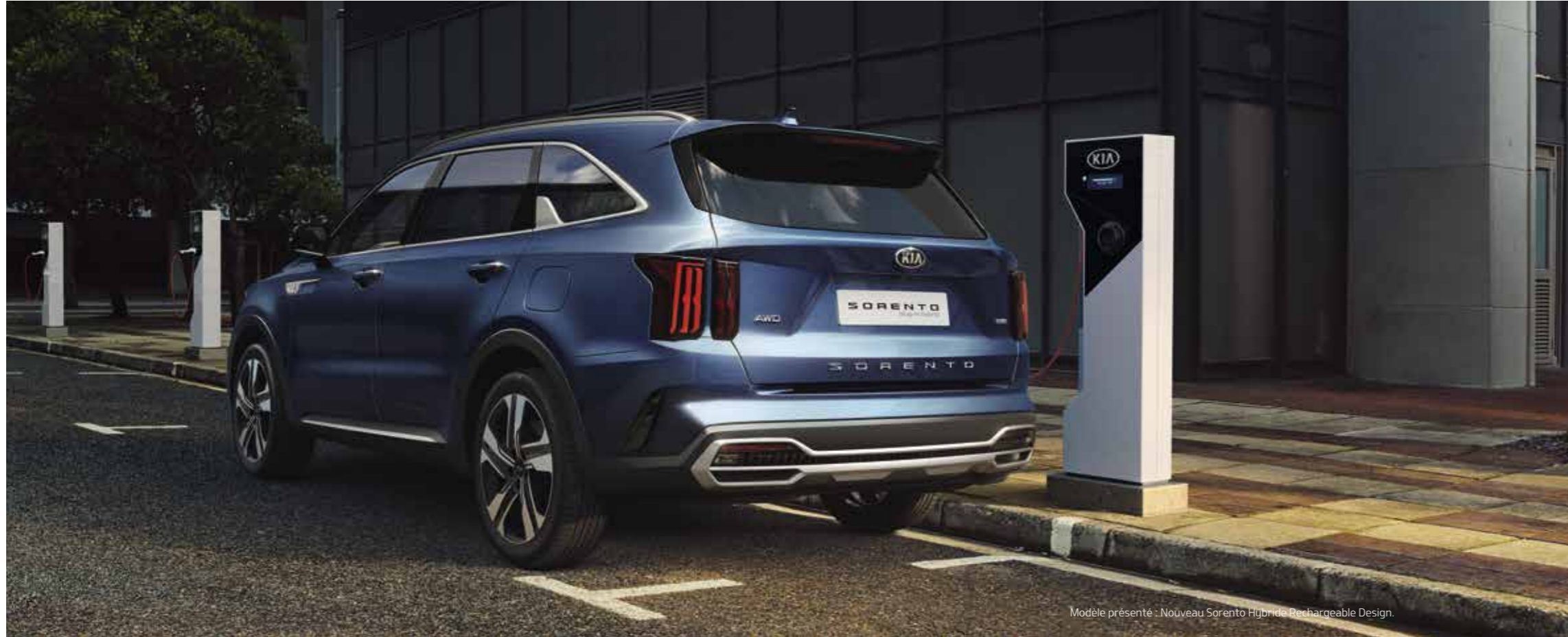
Modèle présenté : Nouveau Sorento Hybride Rechargeable Design.