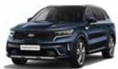
Bleu Saphir (B4U) (1)