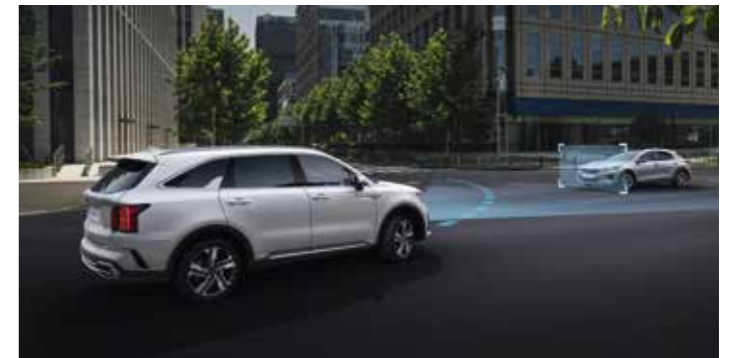
SYSTÈME DE FREINAGE D'URGENCE AUTONOME (FCA)

Ce système utilise des capteurs à ultrasons destinés à détecter la présence d'enfants ou d'animaux de compagnie sur la deuxième ou la troisième rangée, et émet des signaux sonores et visuels s'il détecte un mouvement à bord, avant et après le verrouillage du véhicule.