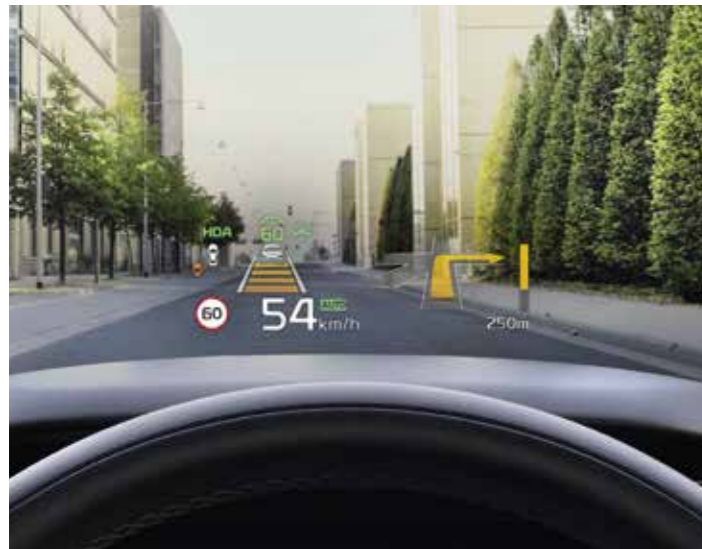
AFFICHAGE TÊTE-HAUTE (HUD)

Quelle satisfaction de savoir que vos proches pourront partager avec vous l'expérience Sorento, en étant confortablement installés dans son habitacle à la fois spacieux et ergonomique.