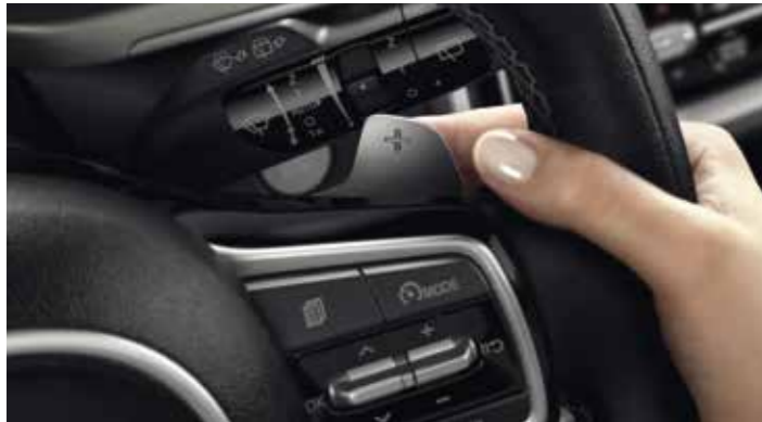
PALETTES DE VITESSES AU VOLANT

Laissez libre cours à vos envies : le nouveau Sorento Hybride Rechargeable est animé par un moteur essence électrifié T-GDi 1,6 litre associé à une transmission à quatre roues motrices.