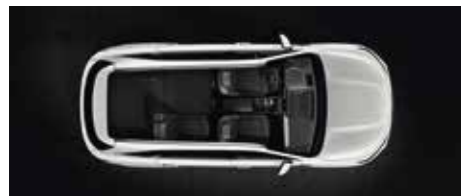
Sièges de la 3 ème rangée totalement repliés à plat et sièges de la 2 ème rangée partiellement repliés