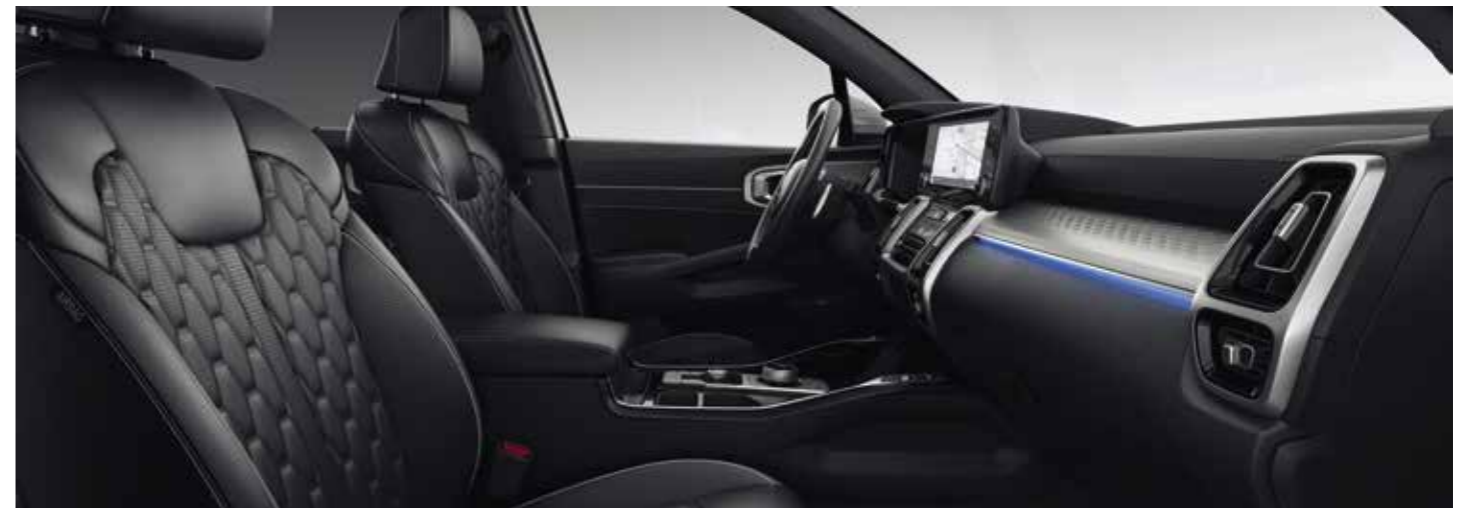
Sellerie cuir noir Nappa matelassé (de série sur la finition Premium)