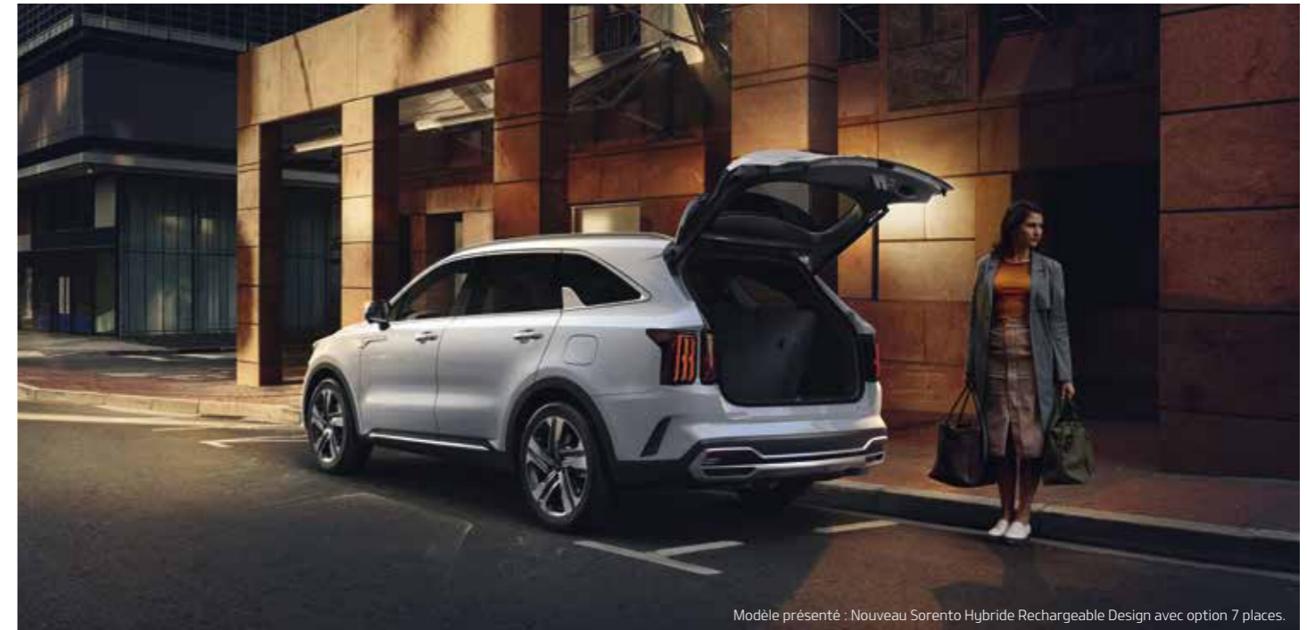
Modèle présenté : Nouveau Sorento Hybride Rechargeable Design avec option 7 places.

Vous voulez repousser vos limites ? Le Sorento vous invite à le faire avec style. Vous bénéficierez d'un maximum de confort, d'espace et de flexibilité, le tout rehaussé par un design extérieur des plus audacieux.