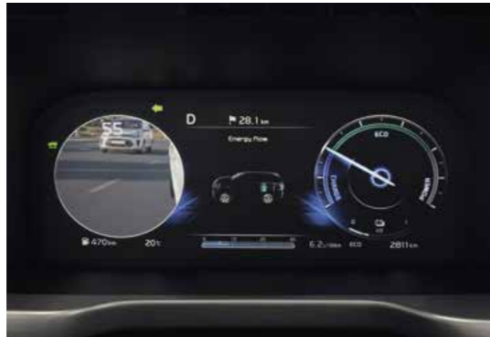
SYSTÈME D'AFFICHAGE DES ANGLES MORTS (BVM)

Si vous entreprenez un changement de voie alors qu'un véhicule se trouve dans votre angle mort, le Sorento serrera automatiquement les freins pour éviter toute collision, les symboles d'avertissement sur le rétroviseur extérieur et l'affichage tête haute clignoteront et un signal sonore se fera entendre.