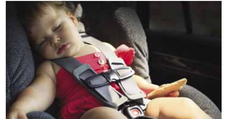
SYSTÈME D'ALERTE DES OCCUPANTS ARRIÈRE (ROA)

Si votre airbag se déclenche suite à une collision primaire, un signal est immédiatement envoyé au système de contrôle électronique de stabilité afin de freiner le véhicule. Le système MCB serre les freins pour éviter toute collision secondaire ou en réduire la gravité.