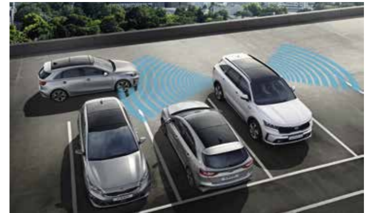
SYSTÈME DE DÉTECTION DE TRAFIC ARRIERE AVEC FONCTION FREINAGE (RCCA)

Le système HDA maintient le véhicule à la vitesse définie par le conducteur ou à la vitesse maximale autorisée de l'autoroute. Parallèlement, il contrôle la direction, l'accélération et la décélération dans votre voie de circulation, tout en conservant une distance de sécurité avec le véhicule en amont. Il est conçu pour ajuster automatiquement votre vitesse en fonction de la limitation de vitesse de la route empruntée, détectée par le système de navigation.