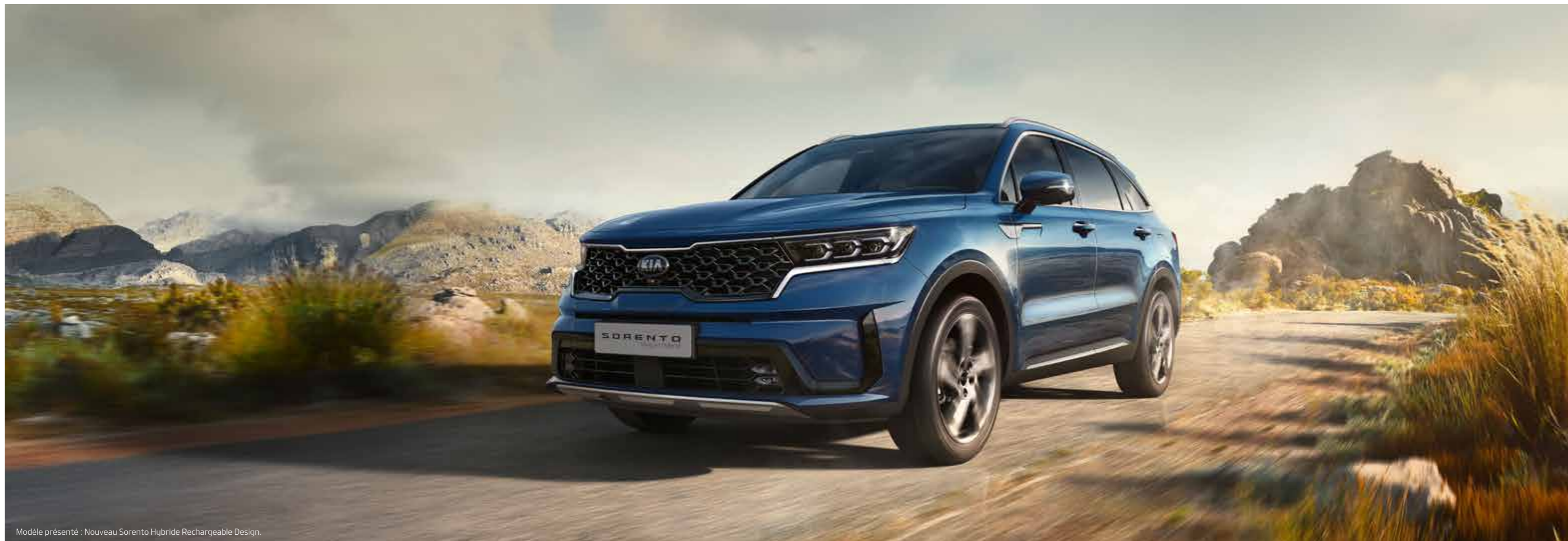
Modèle présenté : Nouveau Sorento Hybride Rechargeable Design.

La transmission intégrale du nouveau Sorento Hybride Rechargeable est conçue pour vous garantir un confort exemplaire à chaque trajet. L'innovante transmission intégrale active en continu confère au véhicule une puissance de traction optimale sur terrains accidentés, meubles ou glissants, tout en contribuant à améliorer sa stabilité latérale en virage. Et avec le nouveau sélecteur Multi-terrain, vous pouvez aisément garder le contrôle en sélectionnant les différents modes de conduite et de terrain les plus appropriés.