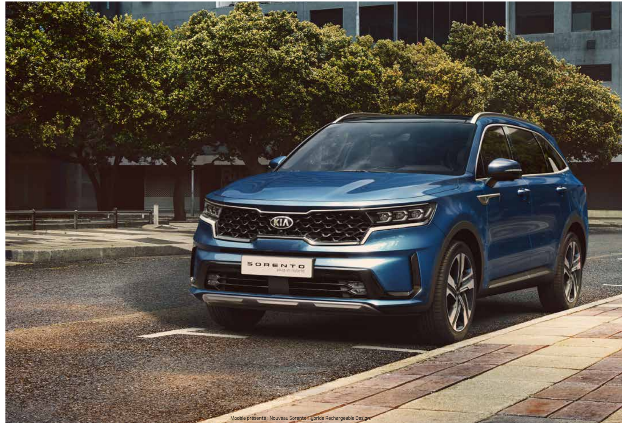
Modèle présenté : Nouveau Sorento Hybride Rechargeable Design.

Le design athlétique et tout en puissance du nouveau Sorento vous permettra d'affirmer votre personnalité sur la route. Admirez sa superbe calandre texturée, rehaussée d'un entourage chromé et noir brillant, son bouclier avant typé sport intégrant une grille de prise d'air en forme d'aile, son sabot de protection avant au profil élégant et ses splendides jantes alliage 19". Sans oublier la nouvelle technologie d'éclairage des projecteurs Full LED (de série dès la finition Active) ainsi que les feux de jour et antibrouillards à LED qui conjuguent à la perfection style et fonctionnalité.