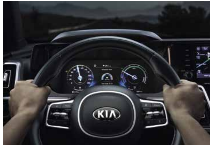
ALERTE DE VIGILANCE DU CONDUCTEUR (DAW)

Lorsque les conditions le permettent, le Kia Sorento allume automatiquement les feux de route. De nuit, lorsque la caméra intégrée au pare-brise détecte les projecteurs d'un autre véhicule approchant, le système de gestion automatique des feux de route permute automatiquement en feux de croisement pour éviter d'éblouir les autres conducteurs.