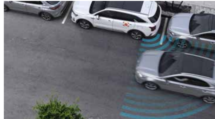
SYSTÈME DE SÉCURITÉ DE SORTIE DU VÉHICULE (SEA)

Conçu pour améliorer la visibilité dans les angles morts, le système BVM (de série sur la finition Premium) utilise des caméras latérales de manière à ce que, lorsque vous enclenchez le clignotant gauche ou droit, le combiné d'instruments affiche la vue de la route située dans l'angle mort. Actionnez le clignotant gauche et le système affichera la vue de la partie arrière gauche de votre véhicule ; actionnez le clignotant droit et le système affichera la vue de la partie arrière droite de votre véhicule.