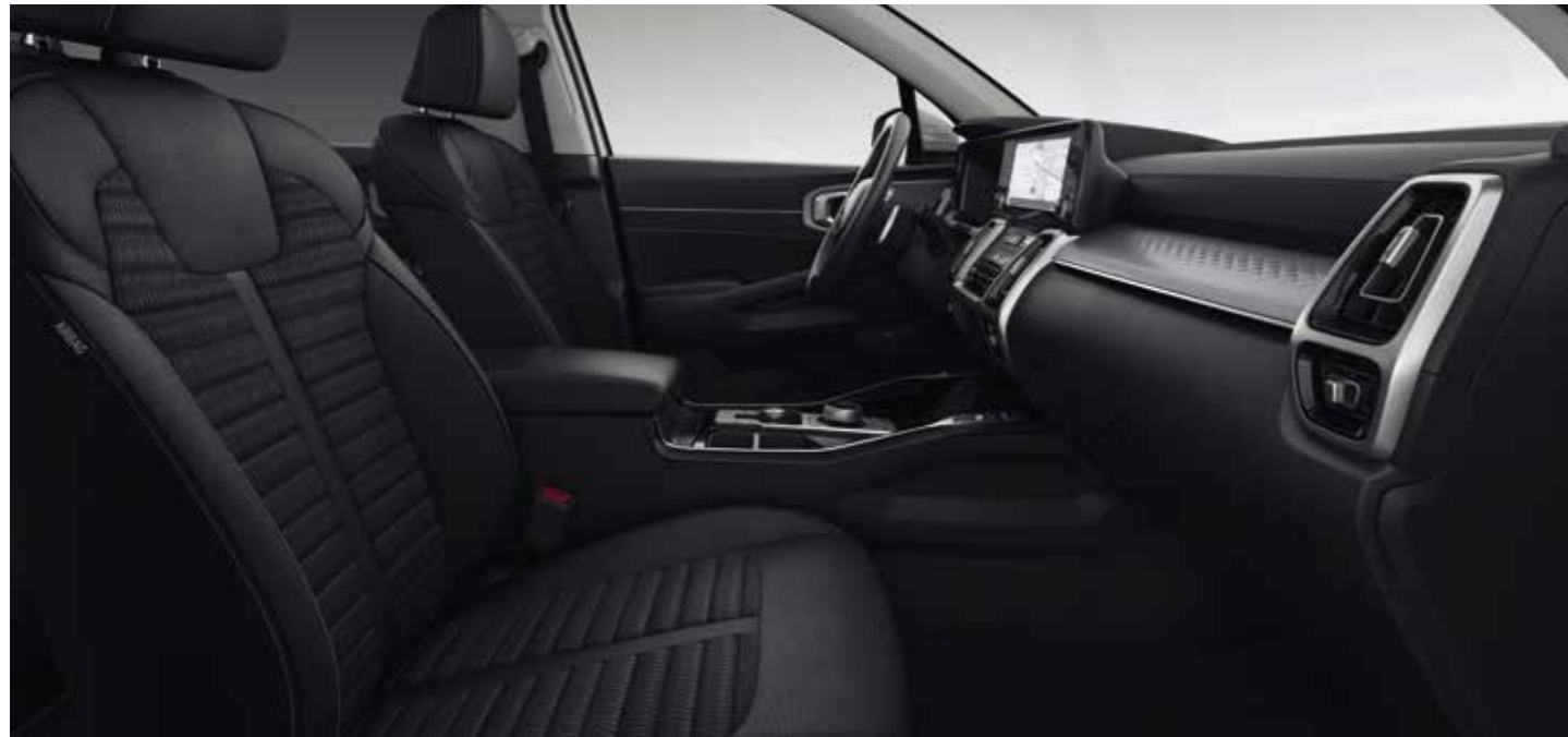
Sellerie tissu noir (de série sur les finitions Motion et Active)

Pour une touche d'élégance supplémentaire, la sellerie en tissu noir arbore un garnissage en finition métallisée avec gaufrage 3D, tandis que tous les sièges en cuir bénéficient d'un garnissage en finition brossée et d'un gaufrage 3D. La sellerie en cuir nappa noir est également complétée par un ciel de pavillon de couleur noire.