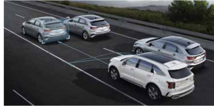
ASSISTANCE ACTIVE A LA CONDUITE DANS LES EMBOUTEILLAGES (LFA)

Le système DAW surveille les sollicitations du volant, des clignotants et de l'accélérateur, et vous avertit en cas de perte de concentration. Par exemple, dans les embouteillages, si le véhicule en amont redémarre et que vous restez à l'arrêt, le système vous alertera ; si vous montrez des signes d'endormissement, il vous encouragera à faire une pause.