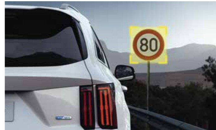
RECONNAISSANCE DES PANNEAUX DE LIMITATION AVEC RÉGULATION DE VITESSE (ISLA)

Lorsque le système ISLA est actif, il utilise une caméra pour lire les panneaux de limitation de vitesse le long de la route, et les affiche près de l'indicateur de vitesse et sur l'écran du système de navigation. Vous pouvez ensuite décider de caler votre vitesse sur cette limitation ou passer outre.