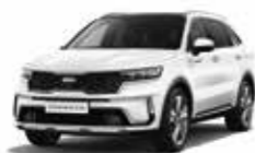
Blanc Nacré (SWP) (2)