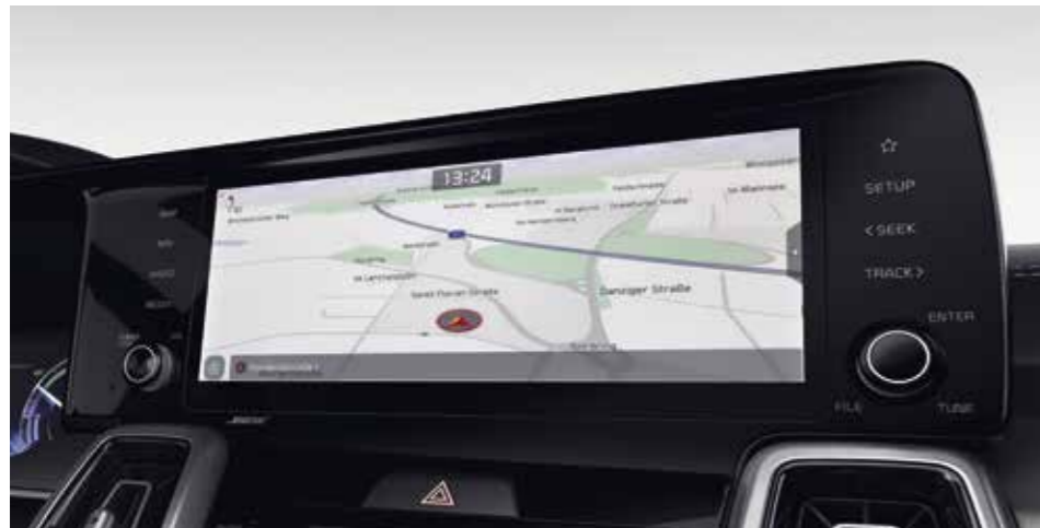
SYSTÈME DE NAVIGATION 10,25"

Dès l'instant où vous monterez à bord du nouveau Kia Sorento, vous découvrirez un éventail de technologies d'information et de divertissement de pointe, conçues pour vous garantir une parfaite maîtrise en toutes circonstances.