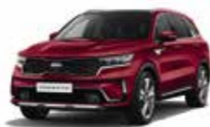
Rouge Magma (CR5) (1)