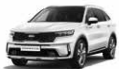
Blanc Céleste (UD)

Choisissez la couleur qui correspond à votre style. Le nouveau Sorento Hybride Rechargeable est disponible avec dix coloris extérieurs différents.