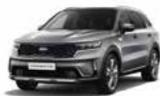
Gris Comète (KLG) (1)