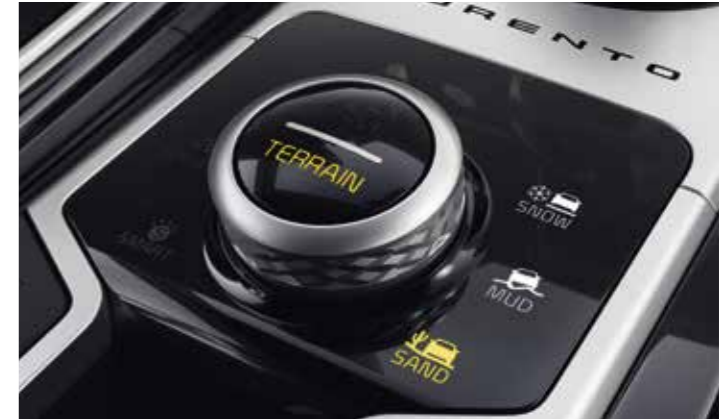
SÉLECTEUR DE MODE DE TERRAIN (TMS)

Le système de sélection du mode de conduite adapte également le degré d'assistance offert par le système de direction assistée, pour une conduite plus détendue ou une plus grande réactivité.