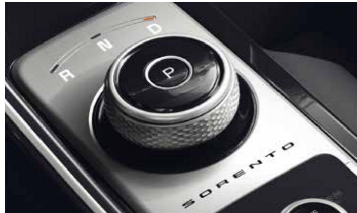
SÉLECTEUR DE RAPPORT ROTATIF

Les élégantes palettes de vitesses au volant en finition chromée se marient parfaitement au design de l'habitacle, et vous permettent de changer de rapport rapidement sans même lâcher le volant. Elles améliorent également la dynamique de conduite, vous permettant de disposer sans effort et plus rapidement d'un couple accru tout en conservant une parfaite maîtrise du véhicule.