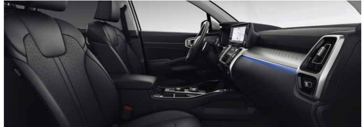
Sellerie cuir noir (de série sur la finition Design)