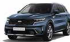
Bleu Minéral (M4B) (1)

(1) Couleur métallisée disponible en option