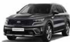
Gris Galène (ABT) (1)