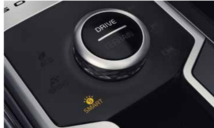
SÉLECTEUR DE MODE DE CONDUITE (DMS)

Le nouveau Sorento Hybride Rechargeable 1.6 T-GDi est équipé de la transmission automatique à six rapports, garantissant ainsi un passage des rapports tout en douceur.