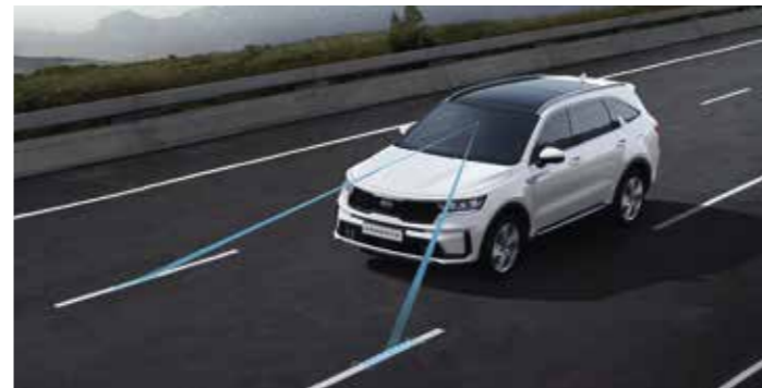
AIDE AU MAINTIEN DANS LA FILE (LKA)

À l'aide d'une caméra et d'un radar, le système SCC maintient la vitesse que vous avez sélectionnée, tout en conservant une distance de sécurité entre vous et le véhicule en amont. Il contrôle également l'accélération et la décélération afin de veiller à ce que votre véhicule s'arrête et redémarre en même temps que véhicule en amont. En outre, le système SCC utilise la navigation (de série à partir de la finition Active) et les données cartographiques ADAS pour réduire automatiquement votre vitesse dans les virages afin d'améliorer votre sécurité et de respecter la limitation de vitesse.