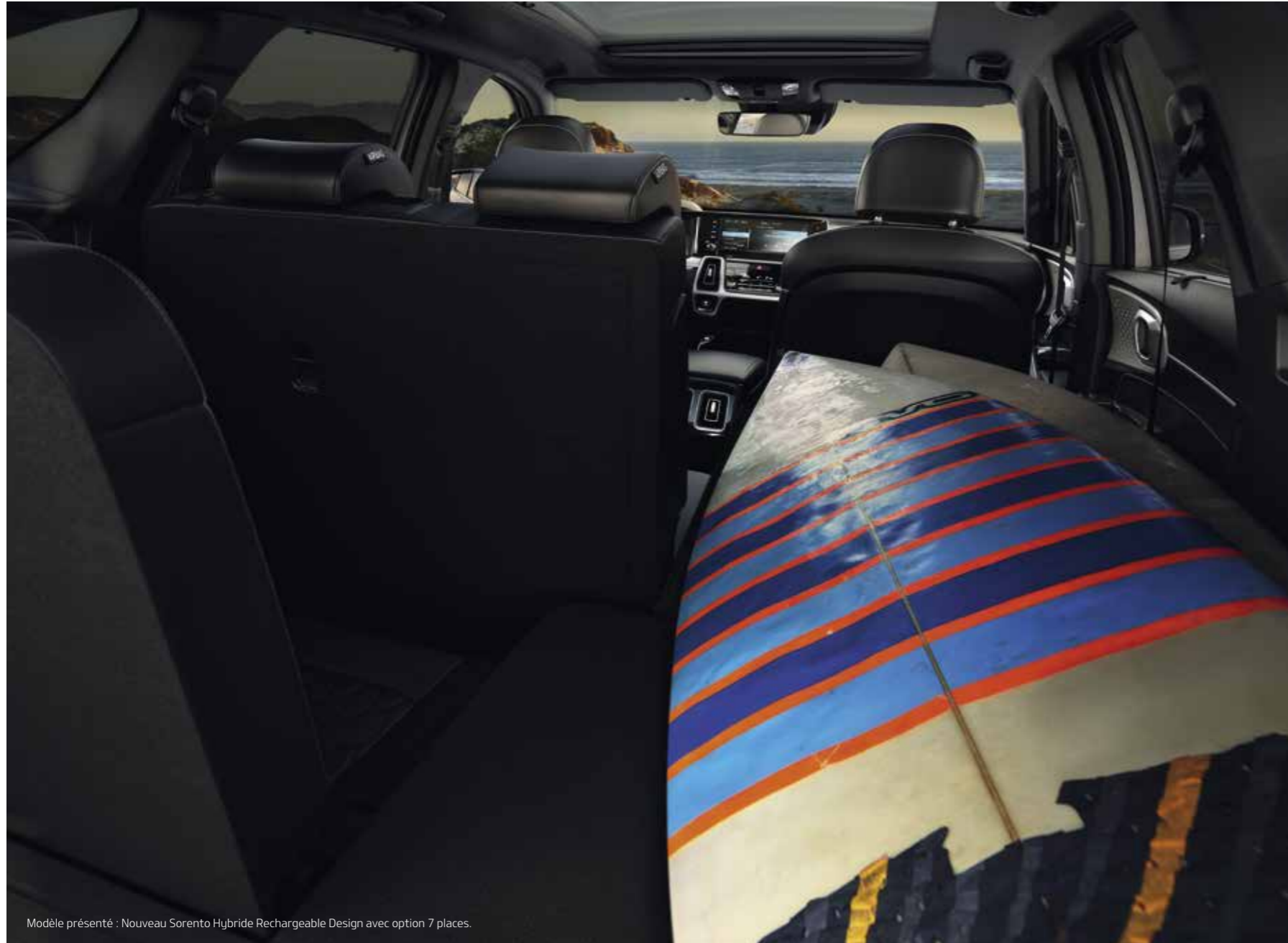
Modèle présenté : Nouveau Sorento Hybride Rechargeable Design avec option 7 places.