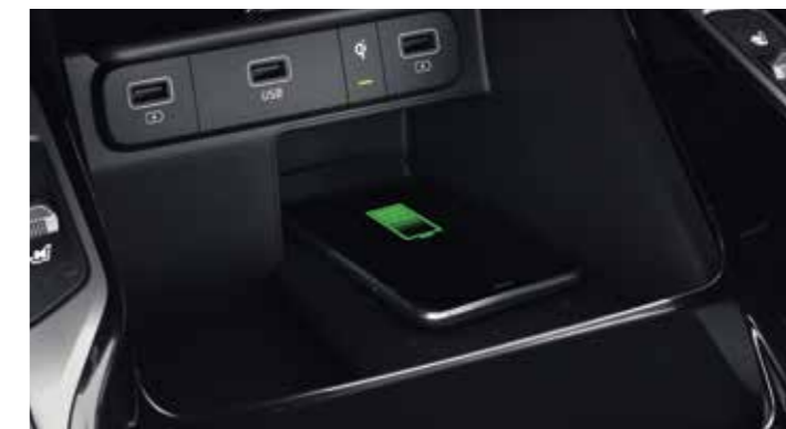
CHARGEUR POUR SMARTPHONE SANS FIL

Les dossiers des sièges de la première rangée intègrent des ports USB destinés aux passagers des première et deuxième rangées. En outre, l'aire de chargement est équipée d'un port USB de chaque côté pour les passagers de la troisième rangée (en option).. Par ailleurs, la console centrale arrière est dotée d'un port USB et d'une prise 12 V – idéal pour jouer et recharger vos appareils.