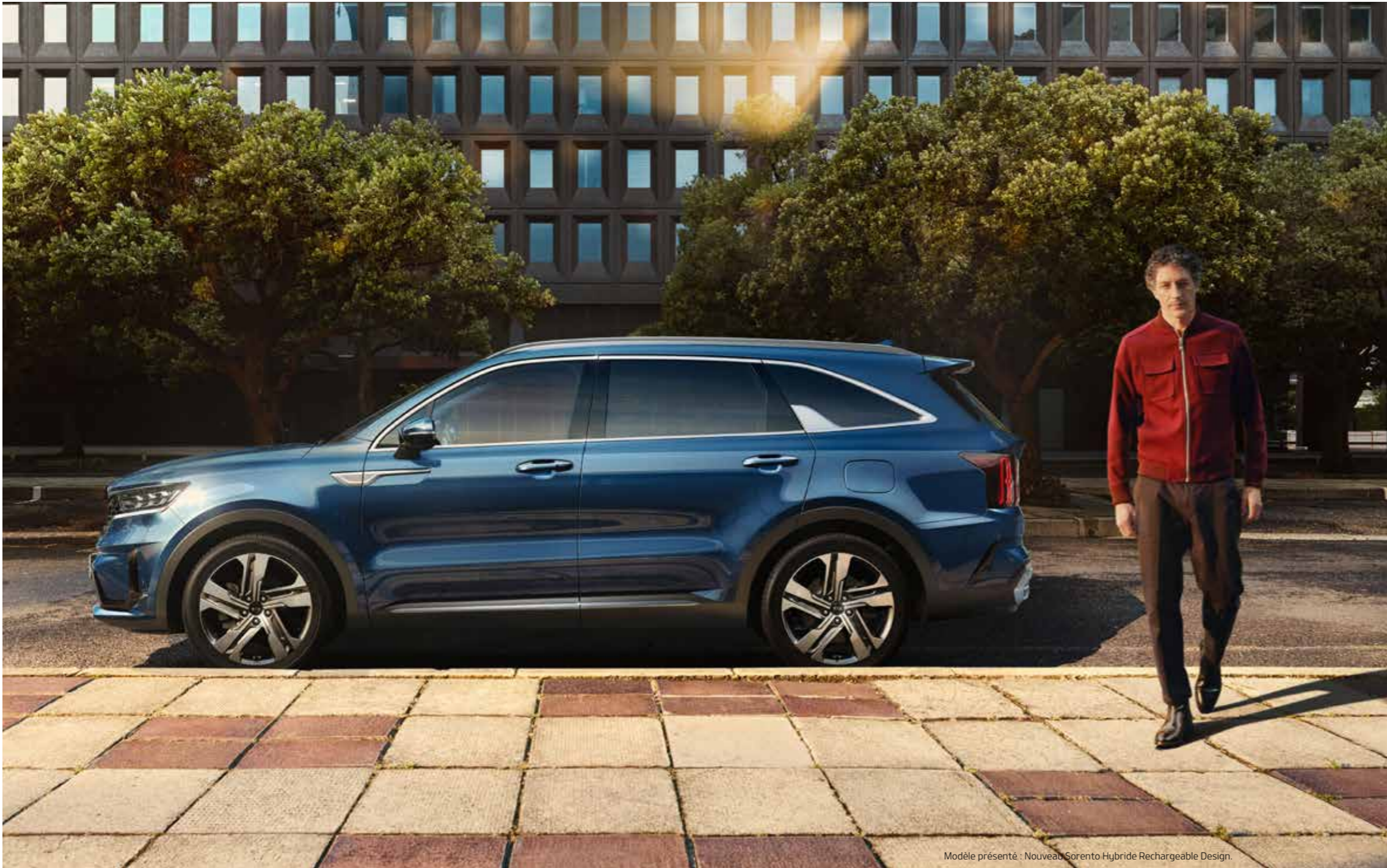
Modèle présenté : Nouveau Sorento Hybride Rechargeable Design.