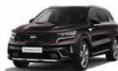
Brun Taïga (BE2) (1)