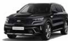
Noir Ebène (ABP) (1)