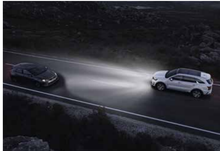
SYSTÈME DE GESTION INTELLIGENTE DES FEUX DE ROUTE (HBA)

Sur les courts comme sur les longs trajets, votre Kia Sorento contribue toujours à votre sécurité et à celle de vos passagers, pour que vous partiez l'esprit tranquille.