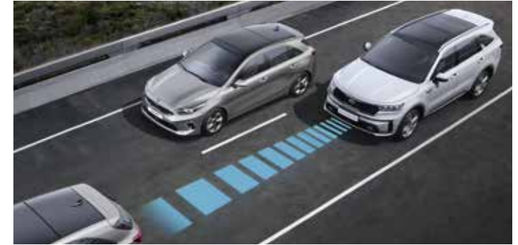
RÉGULATEUR DE VITESSE ADAPTATIF COUPLÉ AU SYSTÈME DE NAVIGATION (NSCC-C)

Ce système utilise une caméra et des capteurs radar pour maintenir une distance de sécurité avec le véhicule qui précède et surveille les marquages au sol pour maintenir le véhicule au milieu de sa voie de circulation. Ce système est opérationnel entre 0 et 180 km/h.