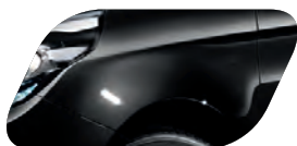
Noir Abyssinie (9H) Métallisé