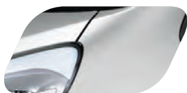
Gris Acier (3D) Métallisé