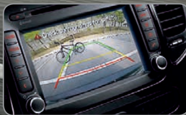
Navigation et caméra de recul