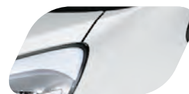
Blanc (UD) Non métallisé

(1) Exemple de financement en Location Longue Durée (LLD) sur 49 mois et 40 000 km pour une Kia Picanto 5 portes UEFA EURO 2016™ 1,0 L essence 66 ch ISG BVM5 (hors options) : 1 er loyer de 1 350 € suivi de 48 loyers mensuels de 117 € TTC (hors assurances et prestations facultatives). Offre réservée aux particuliers, valable jusqu'au 30/06/2016, chez tous les distributeurs Kia participant à l'opération, dans la limite des stocks disponibles. Sous réserve d'acceptation du dossier par Kia Finance, département de CGL, Compagnie Générale de Location d'équipements, SA au capital de 58 606 156 € - 69, av. de Flandre 59708 Marcq-en-Baroeul Cedex - SIREN 303 236 186 RCS Lille Métropole. Les marques citées appartiennent à leurs propriétaires respectifs. Série limitée à 1 200 exemplaires. Conditions sur kia.com .