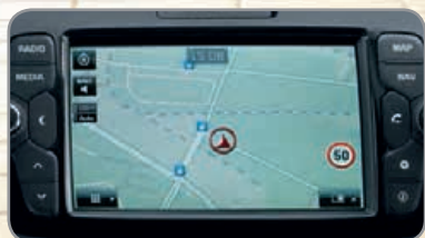
Système de navigation