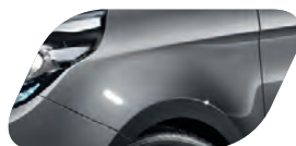
Gris Carnac (IM) Métallisé