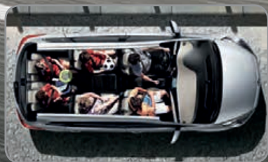
7 places de série