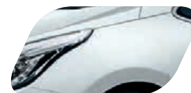
Blanc (WD) Non métallisé

(1) Exemple de financement en Location Longue Durée (LLD) sur 49 mois et 60 000 km pour une nouvelle Kia cee'd UEFA EURO 2016™ 1,0 L essence T-GDi 120 ch ISG BVM6 (hors options) : 1 er loyer de 2 200 € suivi de 48 loyers mensuels de 217 € TTC (hors assurances et prestations facultatives). Offre réservée aux particuliers valable jusqu'au 30/06/2016, chez tous les distributeurs Kia participant à l'opération, dans la limite des stocks disponibles. Sous réserve d'acceptation du dossier par Kia Finance, département de CGL, Compagnie Générale de Location d'équipements, SA au capital de 58 606 156 € - 69, av. de Flandre 59708 Marcq-en-Baroeul Cedex - SIREN 303 236 186 RCS Lille Métropole. (2) Via connexion internet depuis votre téléphone compatible - hors frais de connexion. Les marques citées appartiennent à leurs propriétaires respectifs. Série limitée à 350 exemplaires. Conditions sur kia.com .