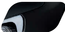
Noir (ABP) Métallisé