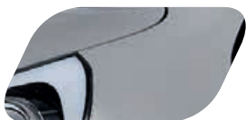
Gris Acier (3D) Métallisé