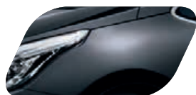
Noir Perlé (1K) Métallisé