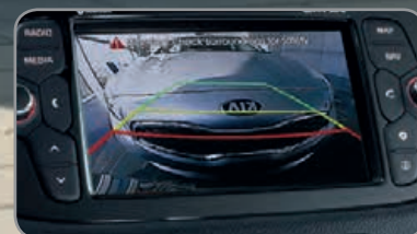
Caméra de recul