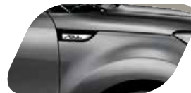
Grey Robot uni (IM) Métallisé