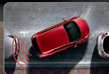
Radars de parking arrière