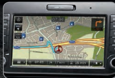
Système de navigation