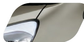
Gris Titane (IM) Métallisé