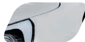
Blanc (UD) Non métallisé