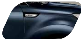
Blue Shark + toit blanc (AH3) Métallisé