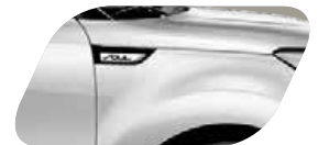
Ghost White uni (1D) Non métallisé

(1) Exemple de financement en Location Longue Durée (LLD) sans apport et sans condition de reprise sur 49 mois et 60 000 km pour un Kia Soul UEFA EURO 2016™ 1,6 L Diesel CRDi 136 ch BVM6 (hors options) : 1 er loyer de 2 550 € suivi de 48 loyers mensuels de 247 € TTC (hors assurances et prestations facultatives). Offre réservée aux particuliers valable jusqu'au 30/06/2016, chez tous les distributeurs Kia participant à l'opération, dans la limite des stocks disponibles. Sous réserve d'acceptation du dossier par Kia Finance, département de CGL, Compagnie Générale de Location d'équipements, SA au capital de 58 606 156 € - 69, av. de Flandre 59708 Marcq-en-Baroeul Cedex - SIREN 303 236 186 RCS Lille Métropole. Les marques citées appartiennent à leurs propriétaires respectifs. Série limitée à 124 exemplaires. Conditions sur kia.com .