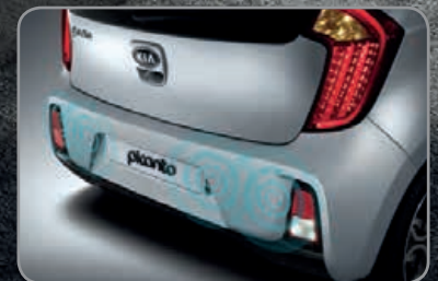
Radars de parking arrière