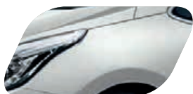
Gris Acier (KCS) Métallisé