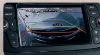
Caméra de recul