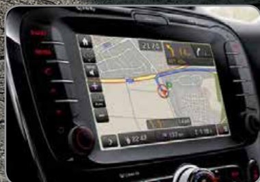
Système de navigation