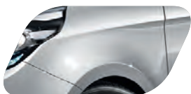
Gris Islande (3D) Métallisé