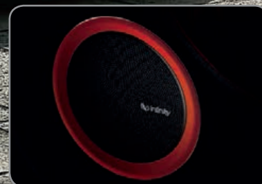
Système audio Infinity®