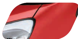
Rouge Grenadine (BEG) Métallisé