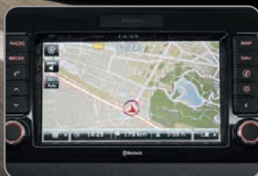
Système de navigation