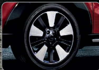
Jantes alliage 18" avec inserts noir laqué