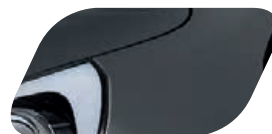
Gris Ardoise (ABT) Métallisé