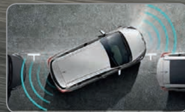
Radars de parking avant et arrière