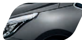
Gris Anthracite (E5B) Métallisé