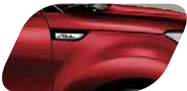
Inferno Red + toit noir (AH4) Métallisé