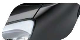
Noir Galaxy (Z1) Métallisé