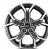
Jantes en alliage 18" (Design & Premium)