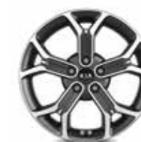
Jantes en alliage 18" (Design & Premium)

Les informations concernant les pneumatiques, en relation avec l'efficacité énergétique et d'autres paramètres d'après le Règlement (UE) 2020/740, sont disponibles sur www.kia.com .