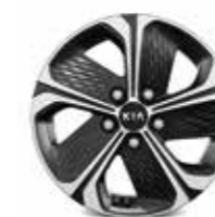
Jantes en alliage 16" (Motion & Active)