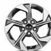
Jantes en alliage 16" (Motion & Active)