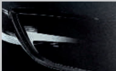
Noir Carbone 2