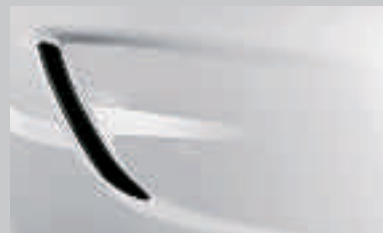
Blanc Olympique 1

Les jantes alliage spécialement conçues pour l'OPC sont en accord parfait avec le design de la voiture. Elles permettent de réduire le poids non suspendu et offre une maniabilité accrue et de meilleures performances dynamiques. Elles donnent à l'Opel Insignia un aspect Haute Performance.