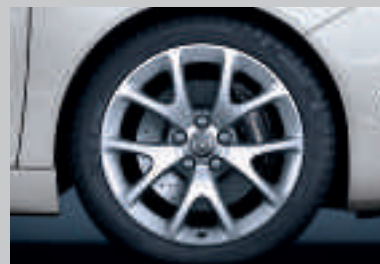
Jantes alliage OPC 19". Finition brillante.

Les jantes alliage spécialement conçues pour l'OPC sont en accord parfait avec le design de la voiture. Elles permettent de réduire le poids non suspendu et offre une maniabilité accrue et de meilleures performances dynamiques. Elles donnent à l'Opel Insignia un aspect Haute Performance.