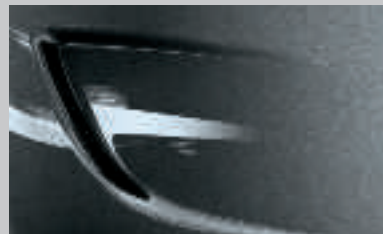
Gris Titane 2