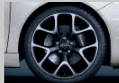
Jantes alliage OPC 20". Peintes en Gris Titane. Finition brillante sur les rayons extérieurs et les bordures.