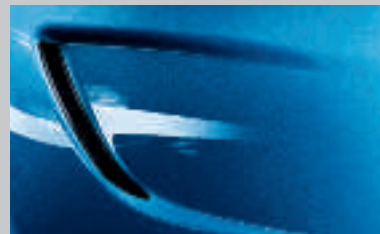
Bleu Bermudes 2