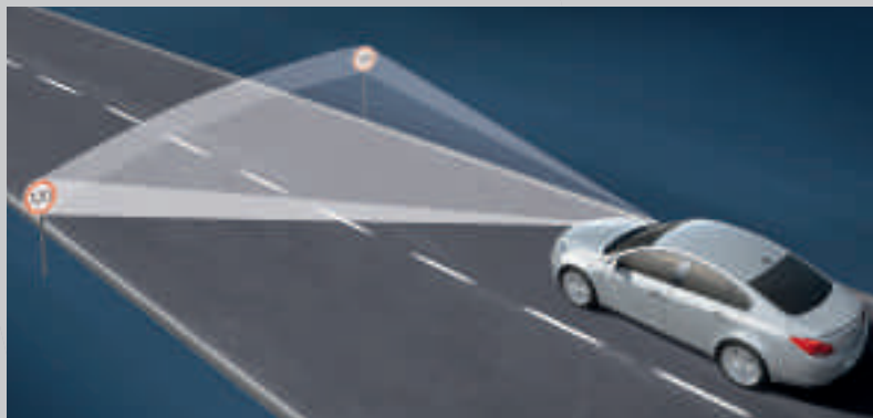
Opel Eye reconnaît puis affiche les panneaux de limitation de vitesse.

Une voiture aussi performante que l'Opel Insignia OPC se doit d'être équipée de systèmes de sécurité très efficaces. Dans ce domaine, Opel dépasse les attentes, en dotant ses véhicules d'un système de phares et de caméras intelligent. Tout cela permet au conducteur de profiter du potentiel de son véhicule tout en gardant l'esprit tranquille.