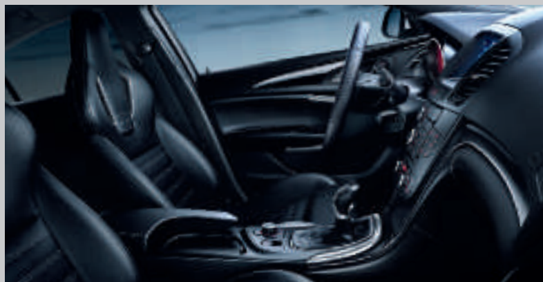
Cuir Siena, Anthracite (perforé)

L'habitacle saura satisfaire les conducteurs les plus exigeants : du ciel de pavillon noir, en passant par le volant en cuir à méplat et le pédalier sport, tout semble parfait.