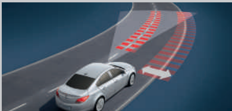
Alerte sonore et visuel lors d'un franchissement de ligne non intentionnel.