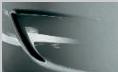
Gris Cèdre 2