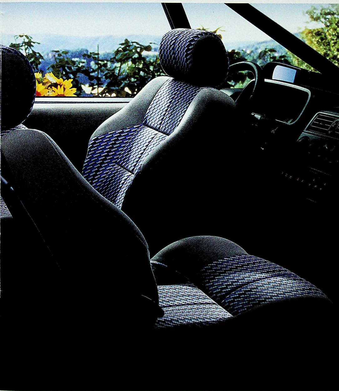
Intérieur RXE V6i avec 2 sièges AR supplémentaires en option

2 sièges supplémentaires à l'arrière*. Et une tablette cache-bagages*. La Renault Espace réinvente le temps: le temps de vivre, tout simplement.