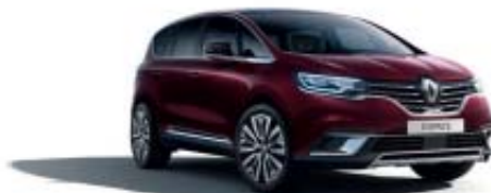
Rouge Millésime (PM)