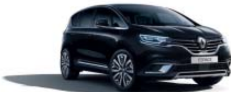
Noir Étoilé (PM)