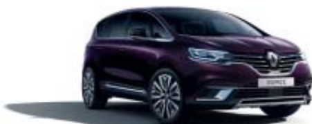
Noir Améthyste (PM)