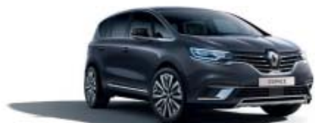
Gris Titanium (PM)