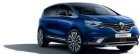
Bleu Cosmos (PM)