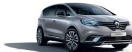
Gris Platine (PM)