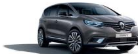
Gris Cassiopée (PM)