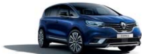
Bleu Cosmos (PM)