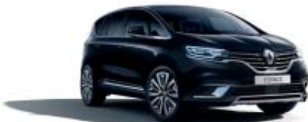
Noir Étoilé (PM)