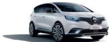
Blanc Glacier (OV)