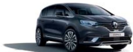
Gris Titanium (PM)