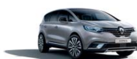
Gris Platine (PM)