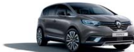
Gris Cassiopée (PM)