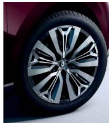
Nouvelle Jante 20"

OV : opaque vernis. PM : peinture métallisée. Photos non contractuelles.