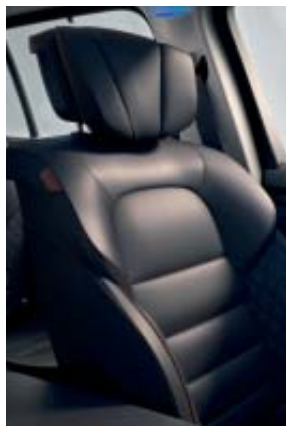
Sellerie Cuir Nappa Gris Sable clair ou Noir Titane