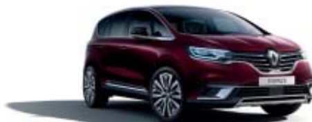
Rouge Millésime (PM)