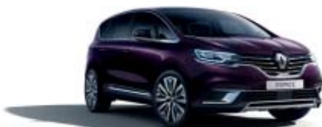
Noir Améthyste (PM)