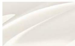
Blanc Cristal 9P9P