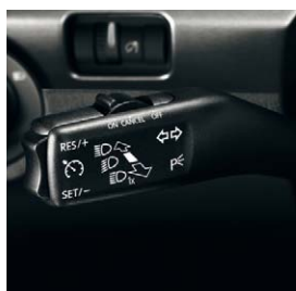
Régulateur de vitesse