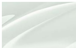
Blanc Laser J3J3