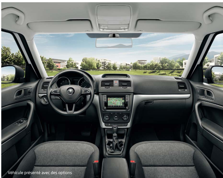
Volant cuir 3 branches multifonctions radio/téléphone

Richement doté, le Yeti Business dispose notamment du système téléphone mobile Bluetooth®, d'un volant cuir 3 branches multifonctions radio/téléphone, des radars de stationnement arrière, de la climatisation mécanique, du régulateur de vitesse et du système GPS "Amundsen" avec cartographie Europe de l'Ouest et information sur l'état du trafic en France.