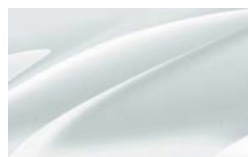
Blanc Lune 2Y2Y