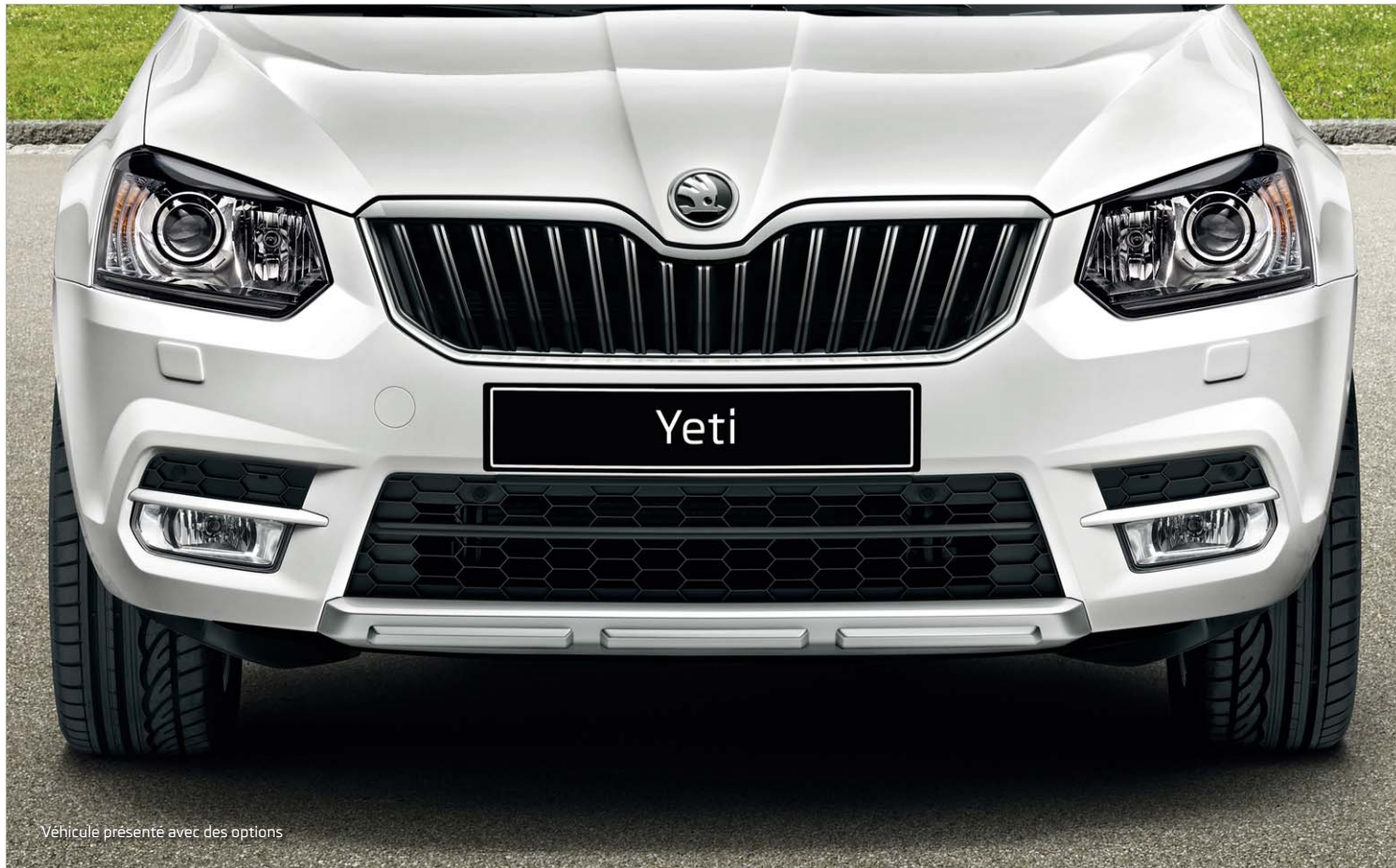
Véhicule présenté avec des options