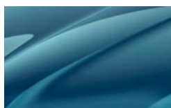
Bleu Lave 0F0F