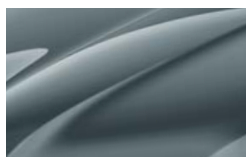
Gris Météore F6F6