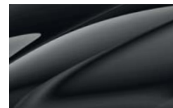
Noir Magic Nacré 1Z1Z