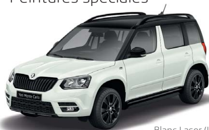
Blanc Laser (J3J3)