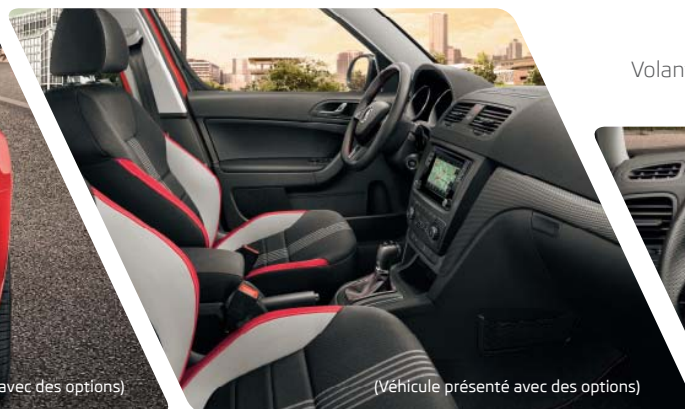
Volant multifonctions Sport 3 branches à méplat