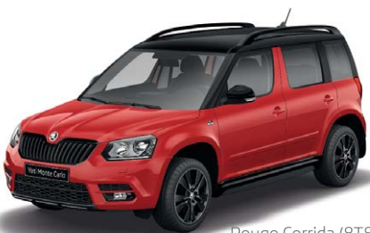
Rouge Corrida (8T8T)