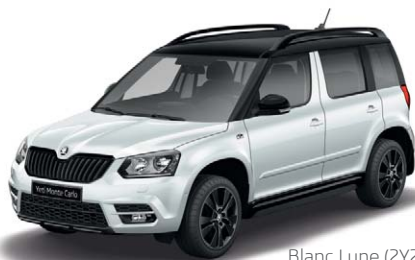
Blanc Lune (2Y2Y)