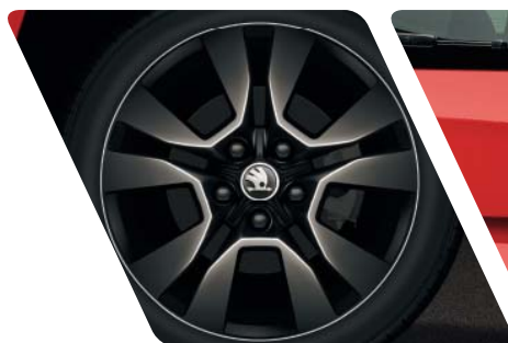
Jantes alliage 17" "Origami Noir"