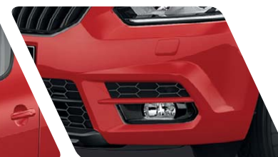
Phares avant antibrouillard