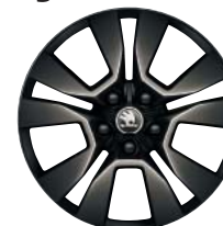
Jantes alliage 17" Origami Noir