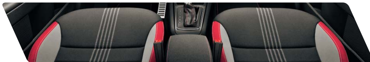
Tissu Monte-Carlo