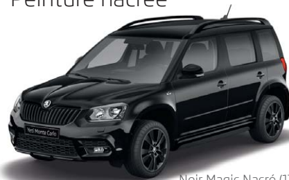
Noir Magic Nacré (I2I2)