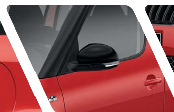
Rétroviseurs extérieurs couleur Noir