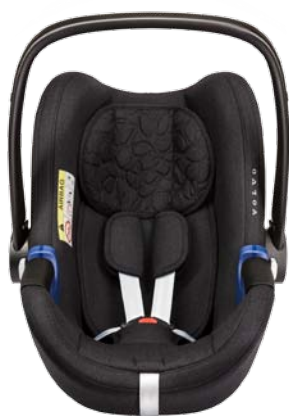
Siège bébé dos à la route (0–13 kg). 340 €

Créez un Volvo XC40 adapté à votre quotidien en choisissant des accessoires Volvo imaginés selon vous et votre voiture. Nos nouveaux sièges enfant conjuguent confort et sécurité de pointe et sont pensés pour se fondre harmonieusement dans votre Volvo. Ils sont durables et résistants, afin que votre enfant puisse voyager lui aussi en toute sécurité.