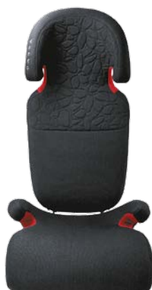
Rehausseur et dossier pour enfant en laine (15–36 kg). 205 €