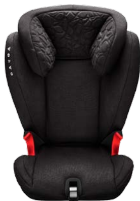
Rehausseur avec appuie-tête réglable (15–36 kg). 305 €