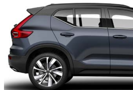
723 Bleu Denim Métallisé