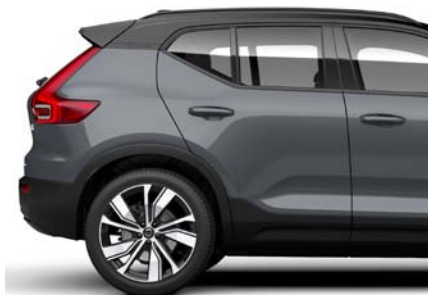
728 Gris Tonnerre Métallisé