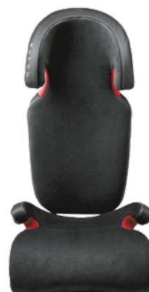
Rehausseur et dossier pour enfant en Cuir/Tissu façon nubuck (15–36 kg). 295 €