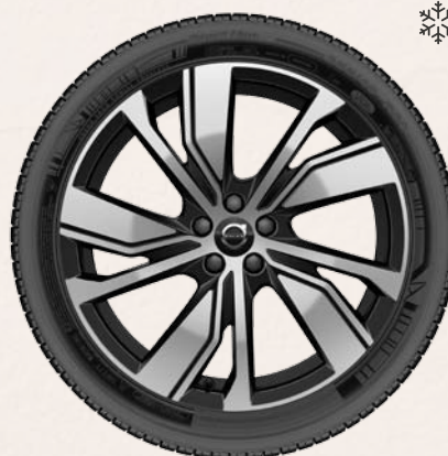
20" 5 branches double en V Graphite Mat / Diamant (en option)