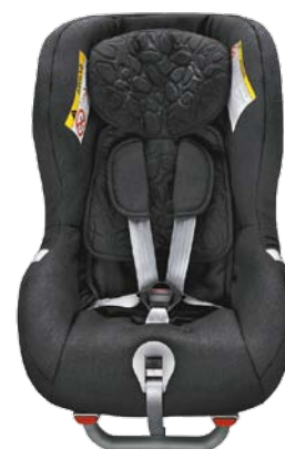
Siège enfant dos à la route (9–25 kg). 430 €