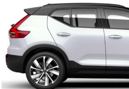
707 Blanc Cristal Métallisé