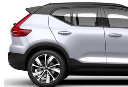
729 Gris Glacier Métallisé