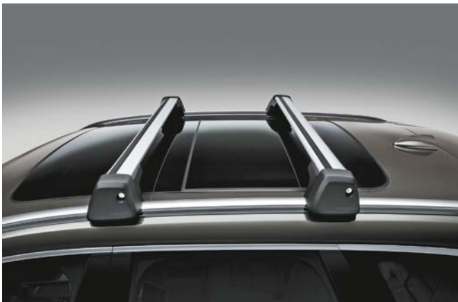
Barres de toit en Aluminium. 200 €

Pour vous permettre de trouver la meilleure solution à vos besoins, quand vous en avez besoin, nous avons créé une gamme d'accessoires de chargement extérieur sur mesure, parfaitement assortis au design du XC40 et à vos envies d'évasion. Fabriqués dans des matériaux robustes et durables, ils résistent aux impitoyables hivers suédois et à une utilisation intensive pour vous accompagner partout.