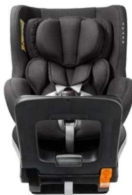
Siège enfant rotatif dos à la route i-Size (0–18 kg). 765 €