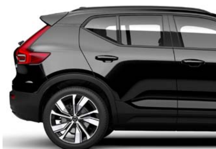
717 Noir Onyx Métallisé